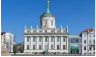
Potsdam Museum – Forum für Kunst und Geschichte