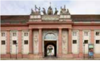
Brandenburg Museum für Zukunft, Gegenwart und Geschichte